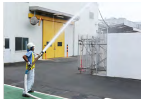
可搬ポンプを使用した消火訓練

更に、関係会社や仕入先に対する現地での安全・防火・防災点検の実施、国内関係会社同士で互いの工場を点検、改善しあう「関係会社安全相互点検」などにより、グループ及びサプライチェーン全体で安全・防火・防災レベルの向上に努めています。